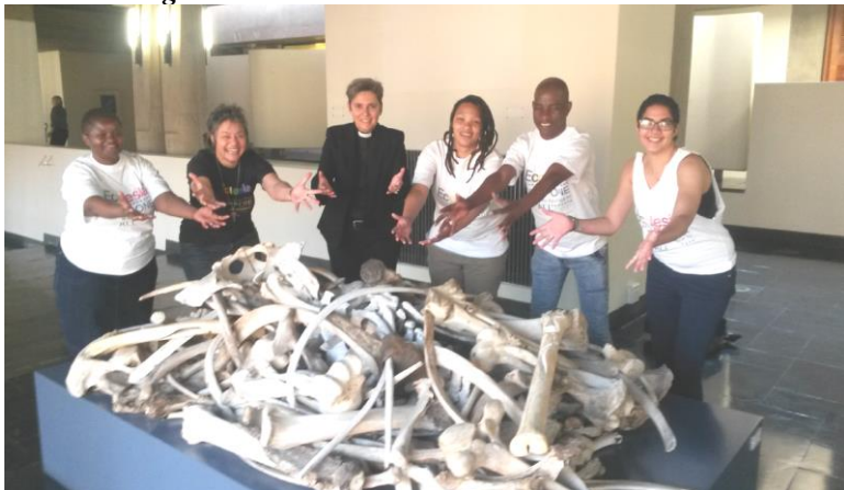
“Only God can bring life to these dead bones”(Ezechiël 37: 1-13)

“IAM teamleden met supporters bij kunstwerk in het Hoog gerechtsgebouw in Johannesburg.”