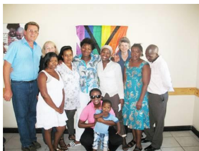
Training in Ithemba Lam (2011)