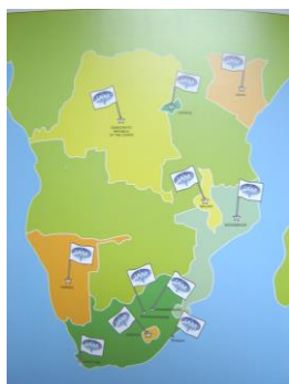
Samenwerking IAM in Afrika (sinds 2002)

We lezen en horen verontrustende berichten uit verschillende landen in Afrika. In diverse landen is de situatie voor LGBTI mensen levensbedreigend. Ook in Zuid-Afrika is de sfeer grimmiger geworden en neemt homofoob geweld toe. Er zijn gelukkig ook lichtpunten, zoals onlangs het nieuws, dat het Constitutionele Hof in Oeganda de anti-homowet, die eerder dit jaar werd ingevoerd, ongeldig verklaarde. IAM werkt samen met organisaties in Zuidelijk Afrika en ondersteunt inmiddels ook groepen in andere Afrikaanse landen.