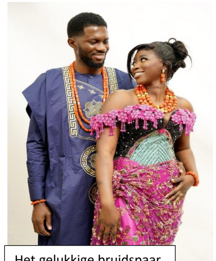
Het gelukkige bruidspaar