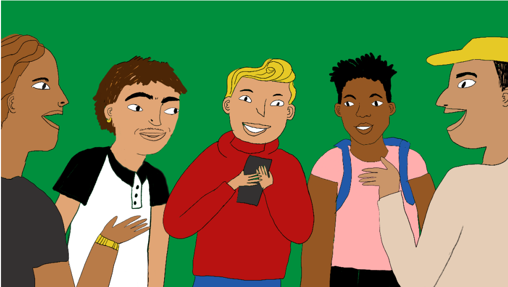
Een screenshot uit de Vragenvuurvideo over gender.

dataverzameling liep tot het voorjaar van 2023 en tegen de tijd dat dit verslag wordt gepubliceerd verwachten we de resultaten.