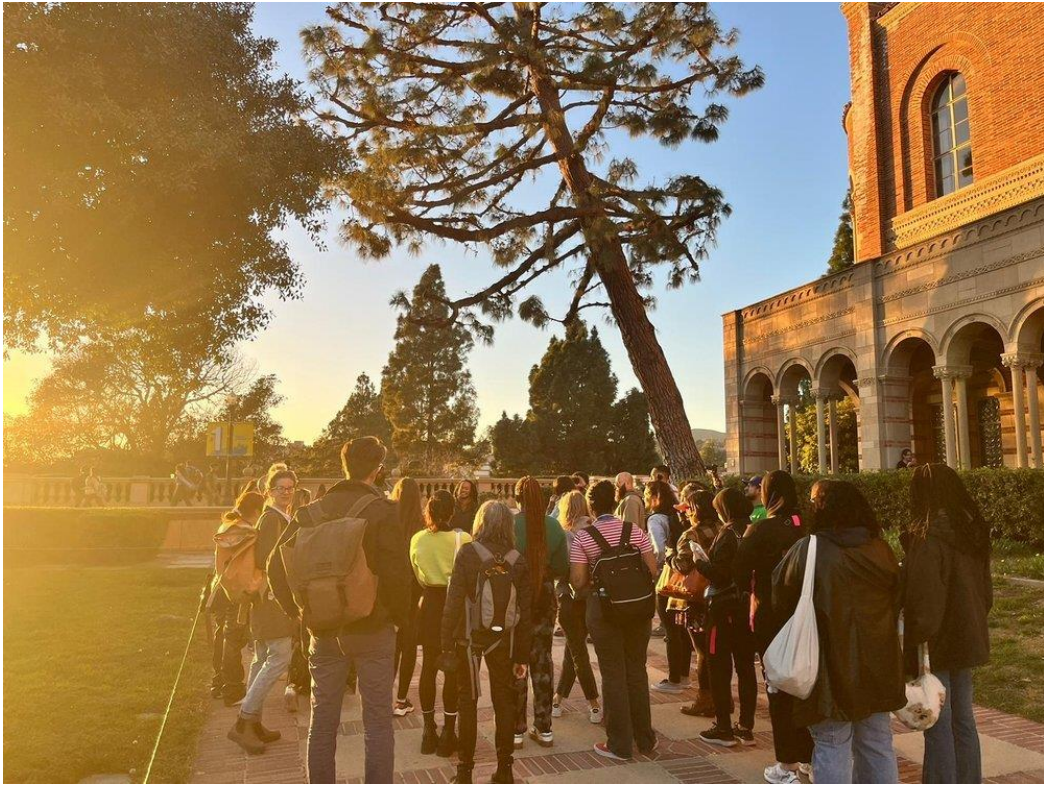
Foto gemaakt tijdens een tour bij UCLA, tijdens het Confident Futures Project.