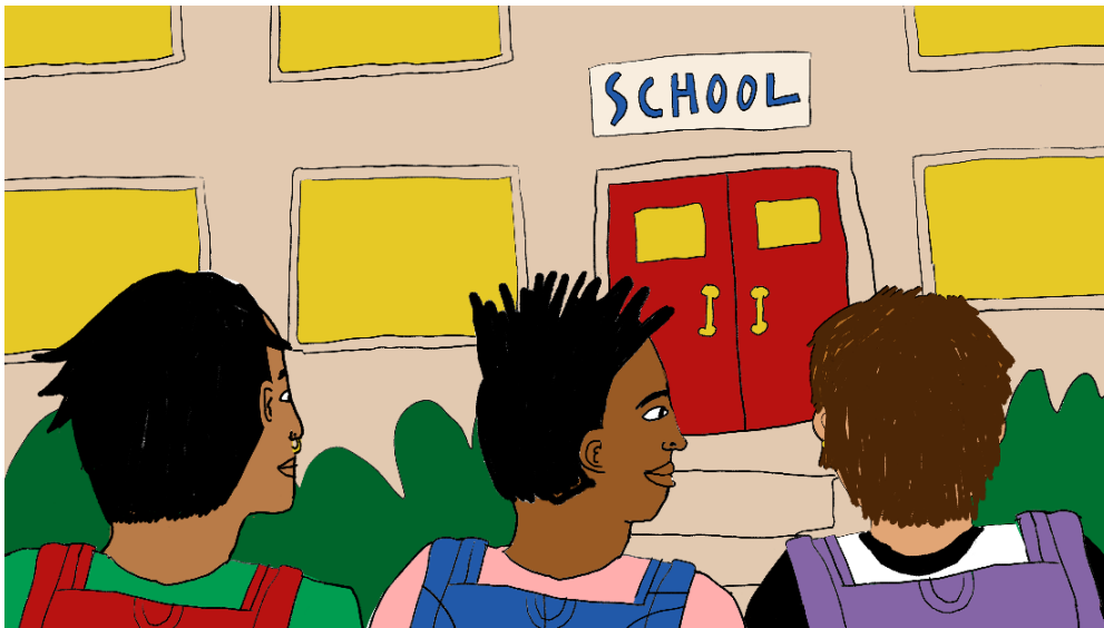
Een screenshot uit de Vragenvuurvideo over gender.