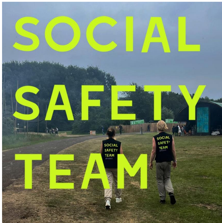
Social safety Team try-out op Dekmantel.