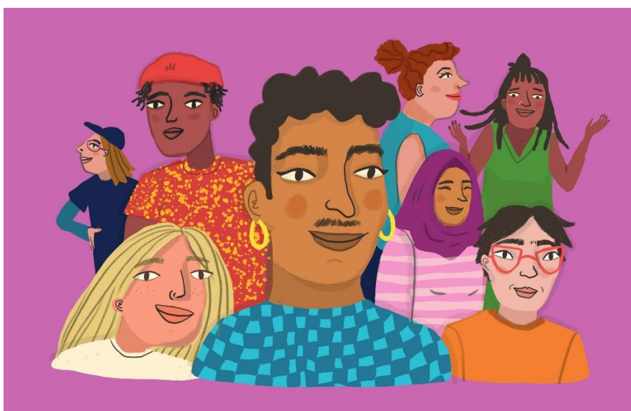
Een van de Illustraties van het included project.

Sexmatters geeft workshops en trainingen over seksualiteit, gender, consent en sociale veiligheid. We richten ons in eerste plaats op jongeren en jong-volwassenen en daarnaast op het systeem waarin jonge mensen opgroeien, leren, ontmoeten en werken. Tijdens onze activiteiten wordt kennis gedeeld, worden ervaringen uitgewisseld en stimuleren we een dialoog over sociaal- maatschappelijke onderwerpen. We werken met een divers team van jonge professionals die aansluiten bij de leefwereld van de doelgroep.