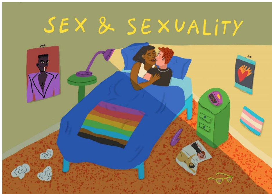
Een van de Illustraties van het included project.

Sexmatters heeft deelgenomen aan het Erasmus+ project INCLUDED. Dit project heeft als doel het ontwerpen en implementeren van een inclusief curriculum voor seksuele opvoeding voor middelbare scholieren. Samen met organisaties uit zes verschillende Europese landen hebben we gewerkt aan inclusief voorlichtings materiaal voor leerlingen, docententrainingen en voorlichtingen voor ouders. Het project zal in juni 2023 worden afgerond.