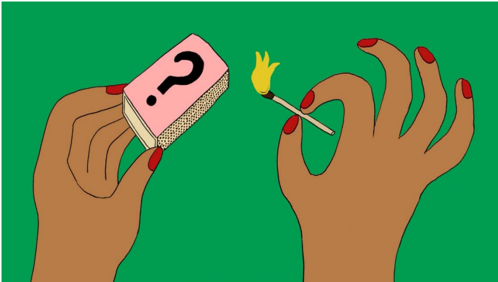
Een screenshot van de intro van het nieuwste seizoen Vragenvuurvideos.

precieze inhoud van de filmpjes wordt bepaald aan de hand van vragen van jongeren over deze thema's. De serie wordt gemaakt door jongeren, waarvan een groot deel uit het vaste Sexmatters team bestaat, en bevat een divers palet aan ervaringen en verhalen waardoor verschillende jongeren zich in hen kunnen herkennen. Voor dit project hebben we een financieringsaanvraag ingediend bij Fonds21