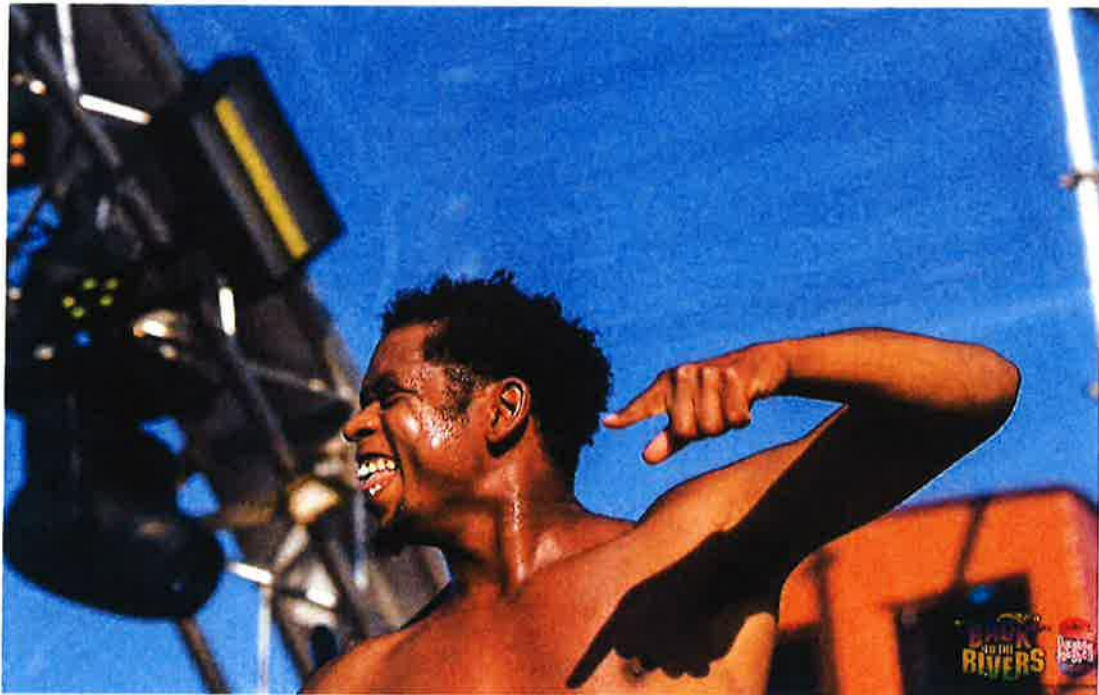
Typhoon kan zijn geluk niet op. Het eerste optreden na de lockdown

Normaal gesproken wordt er bij het Big Rivers Festival ingezet op Crowdfunding. Gezien het nu over een festival ging waarbij entree werd geheven is hier niet op ingezet.