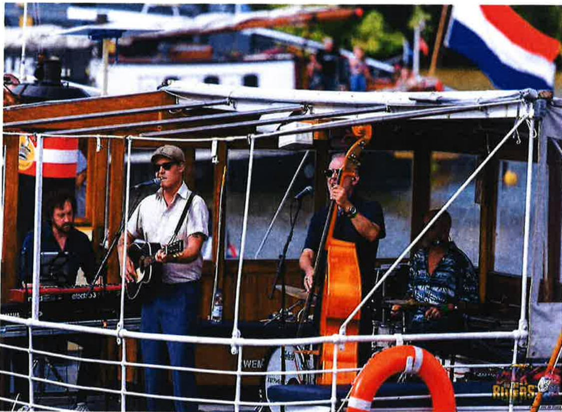
The Wanderers varend en spelend door het Wantij

https://www.youtube.com/watch?v=dQeUU_Q_SW8