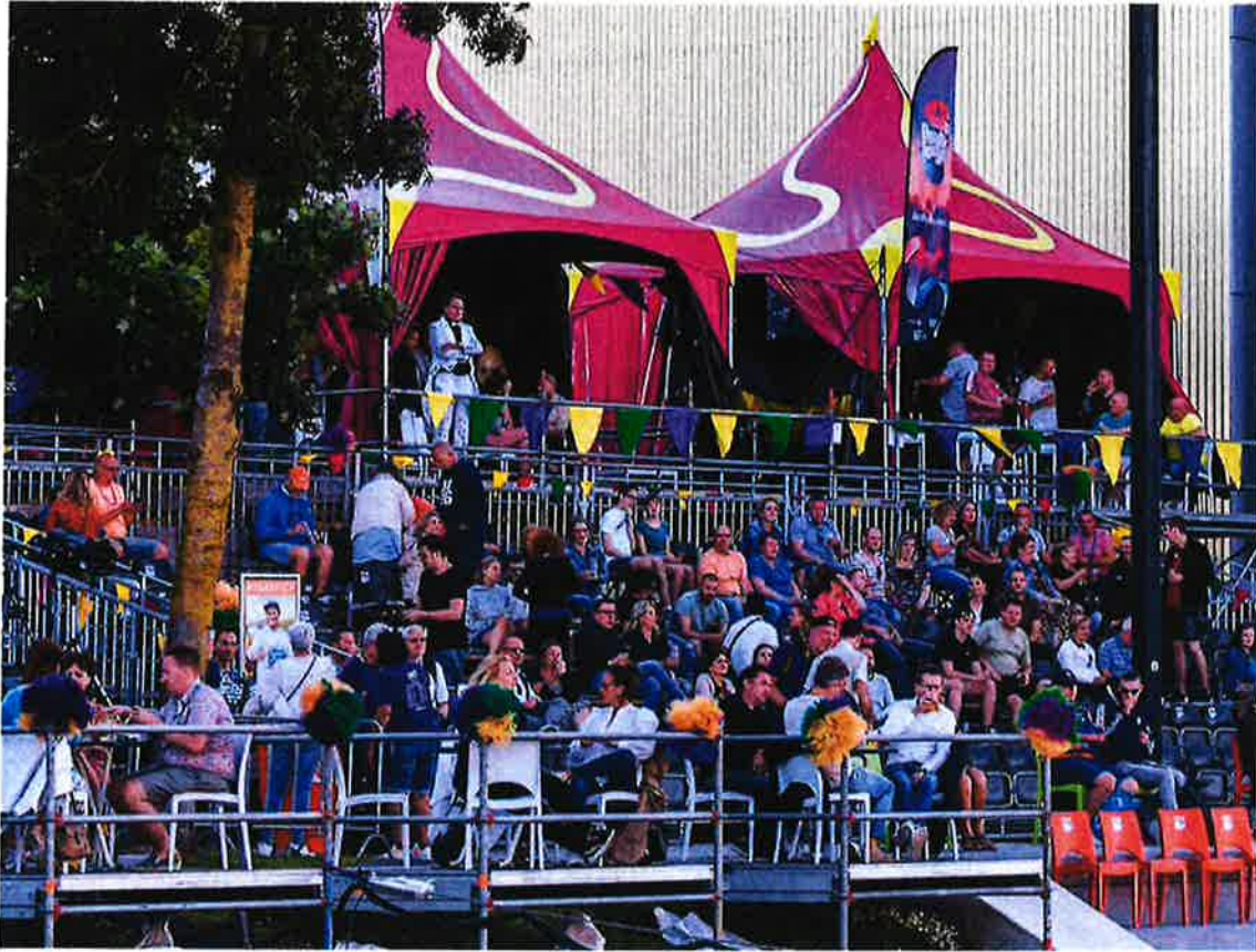
Publiek op 1.5 mtr

zouden worden uitgevoerd. Al was het om een stip aan de horizon te bieden. Deze evenementen zouden moeten worden uitgevoerd op speciale Corona-proof ontwikkelde terreinen.