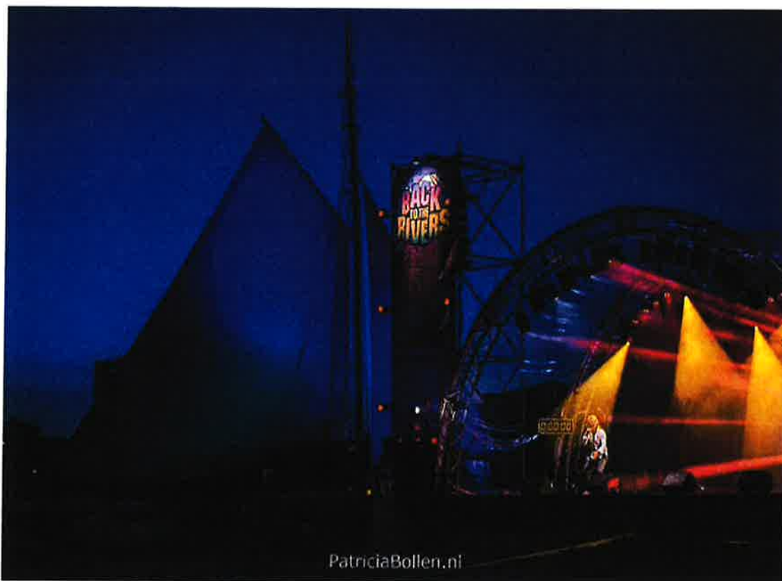
Sprookjesachtige sferen aan de Energiekade

Tot slot grote dank aan Vereniging de Binnenvaart en Stichting de Insteekhaven voor de levering van schepen en de broodnodige adviezen.