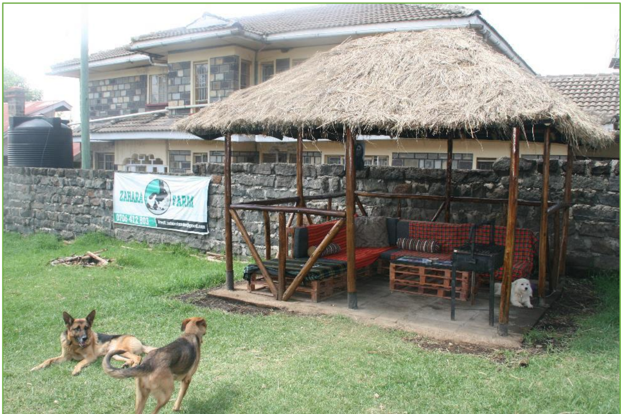
Figure 1: Zahara Lounge

We hebben hier ook regelmatig jongeren die hier voor enige tijd verblijven. Zo werd er een 'pool table' gedoneerd aan ons, waarmee ze zich met vrienden kunnen vermaken.